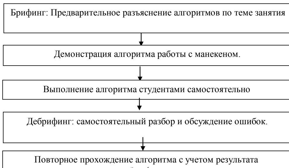
Рис.1. Алгоритм работы в Аккредитационно-симуляционном центре.

Практические занятия проводятся в Аккредитационно-симуляционном центре в виде прохождений симуляционных сценариев, интерактивной симуляции (согласно алгоритму, представленному на рис. 1.), отработки практических навыков на тренажерах и манекенах, собеседования-обсуждения (дебрифинг).