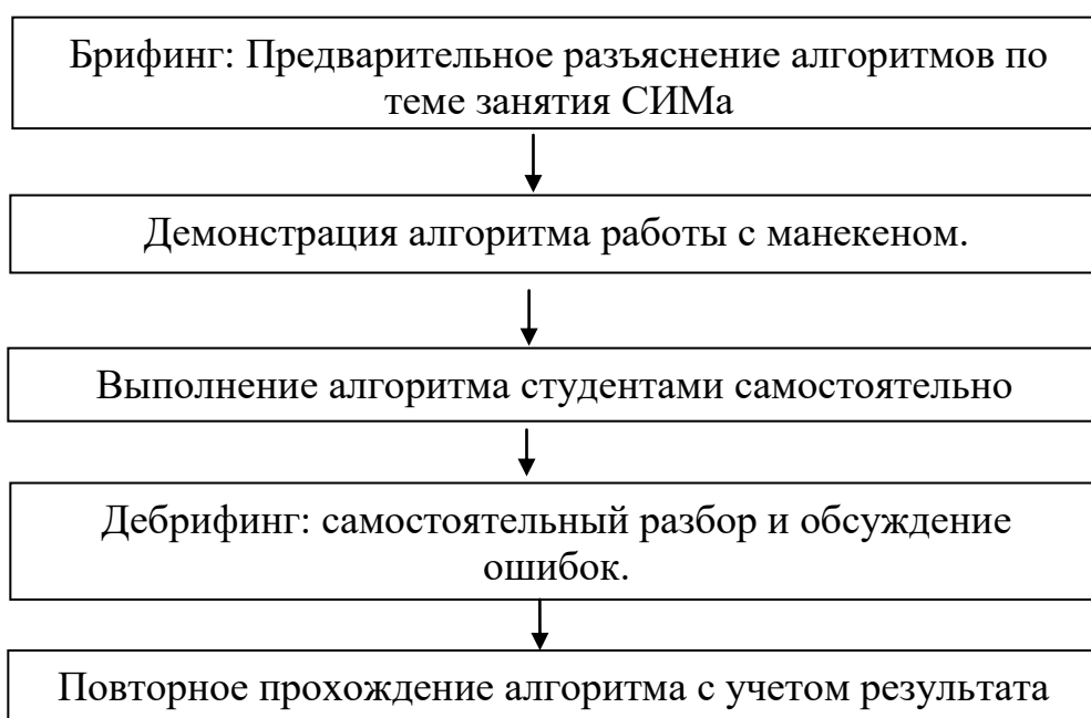
Рис.1. Алгоритм работы в аккредитационно-симуляционном центре

Практическое занятие по темам «Венозные тромбозы. ТЭЛА» и «Травма грудной клетки» проводятся в аккредитационно-симуляционном центре в виде прохождений симуляций, интерактивной симуляции (согласно алгоритму, представленному на рис. 1.), отработки практических навыков выполнения плеврoцентеза и плевральной пункции на тренажерах и манекенах, собеседования-обсуждения (дебрифинг).