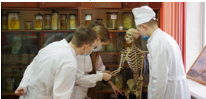
На занятии по анатомии.