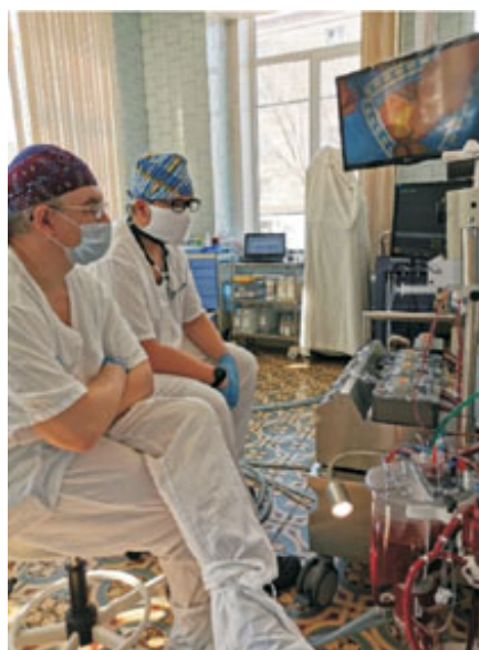
Врачи следят за показаниями приборов.