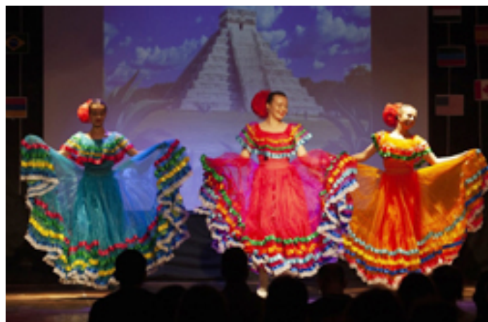
«Студенческая весна» – фестиваль талантов, который проходит в академии уже больше 60 лет. В академии много танцевальных коллективов.