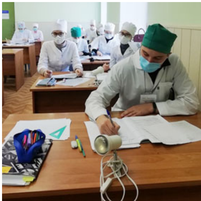
Студенты третьего курса на занятиях по гистологии.

Специалист ведет необходимую документацию (заполнение карточек, составление отчетов и про-