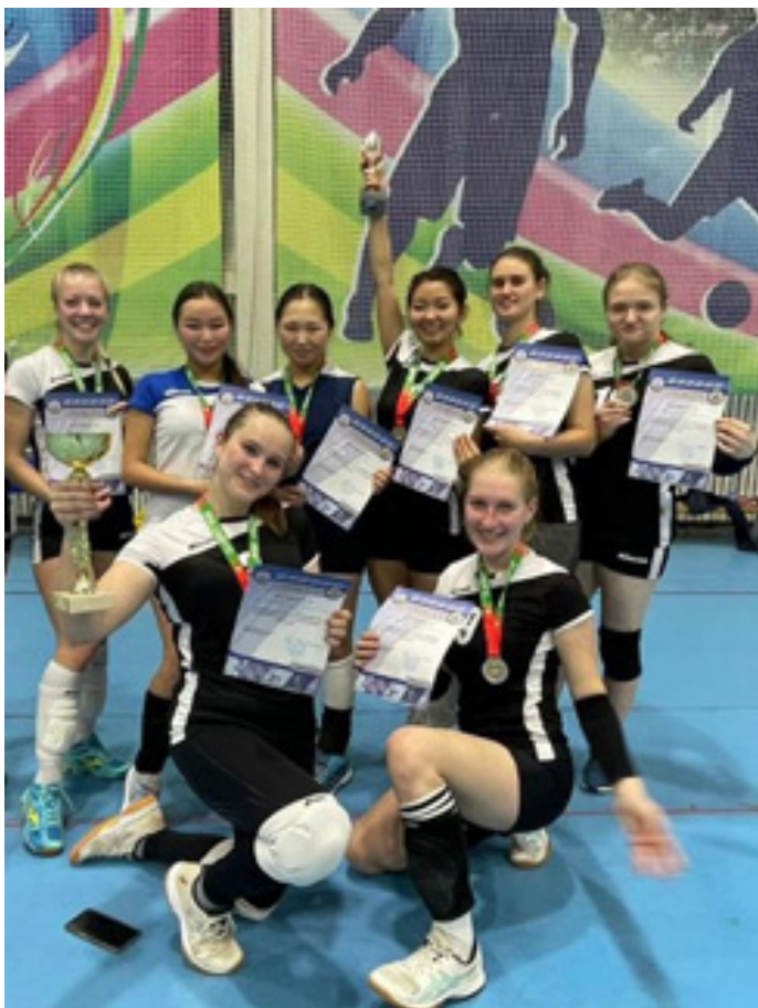
Спортсмены ФГБОУ ВО Амурская ГМА Минздрава России регулярно участвуют в городских, областных, региональных и всероссийских соревнованиях по многим видам спорта. Женская сборная по волейболу.