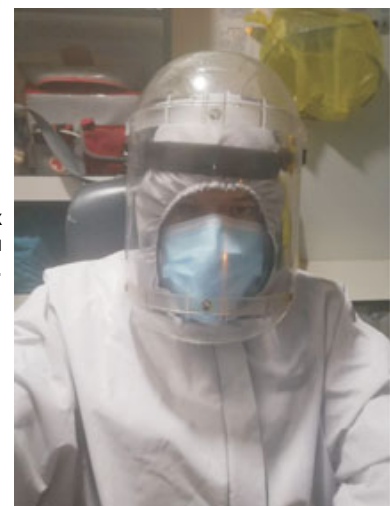
В таких защитных костюмах работают врачи в ковидных госпиталях.