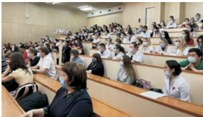
В аудитории академии.

Информация об условиях приемной кампании 2022 года размещена на сайте академии www.amursma.ru в разделе «Абитуриенту. Приемная комиссия». Электронная почта приемной комиссии: abitur@amursma.su