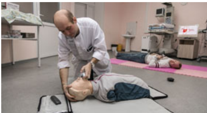
На занятии в Аккредитационно-симуляционном центре академии.

В случае отказа от выполнения условий договора, целевик будет должен возместить потраченные на его обучение средства.