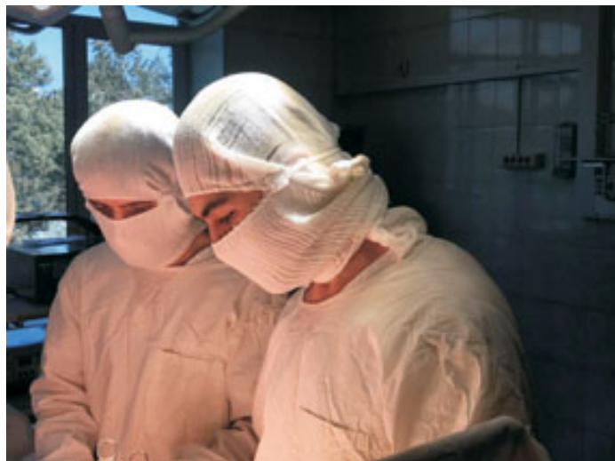
У операционного стола.

Электронная почта: abitur@amursma.ru Подробности для поступающих здесь: https://www.amursma.ru в разделе «Абитуриенту. Приемная комиссия».