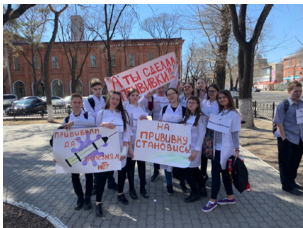
На акции «На прививку становись!»

P.S. Медицинские классы ФГБОУ ВО Амурская ГМА Минздрава России действуют в благовещенской гимназии №1, лицеях №№ 6 и 11, школ №№ 13 и 27, а также школ сел Тамбовка и Березовка.