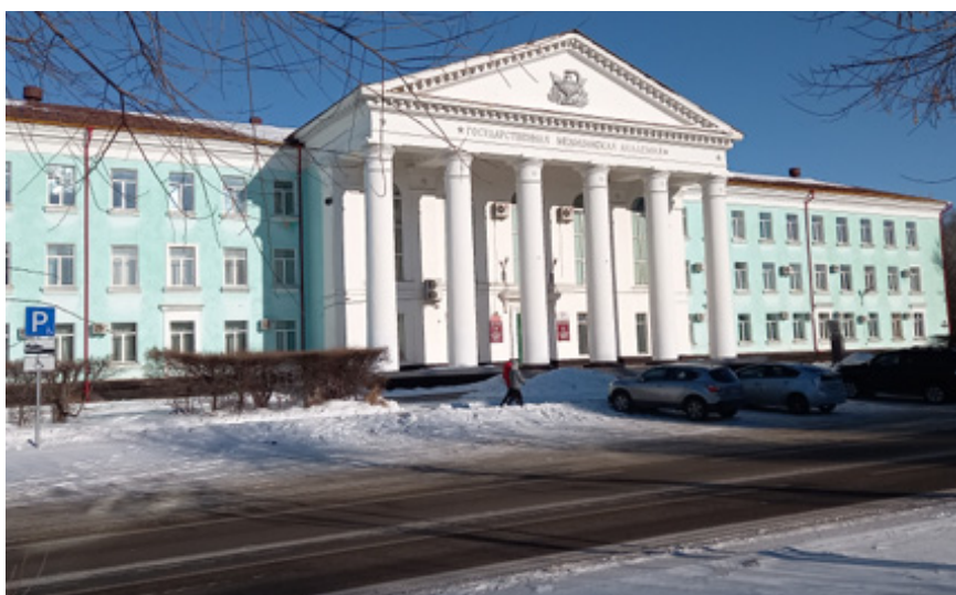
На снимке – административный корпус академии.

ФГБОУ ВО Амурская ГМА Минздрава России входит в число лучших медицинских вузов России.